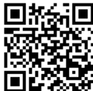
Figura 5 – QR Code do Jogo