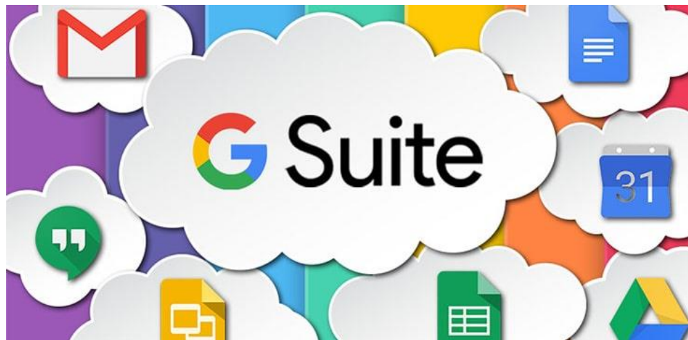
Figura 1 – Interface inicial do Google for Education

Silva et al. (2020, p. 4) relata que: "O Google For Education é uma plataforma que disponibiliza um pacote de ferramentas ou aplicativos de produtividade para ajudar estudantes e professores a interagir de forma contínua e segura em vários dispositivos". Dessa forma, estaremos disponibilizando o link do nosso Produto Educacional para que todo aluno ou professor que possua um aparelho com internet possa participar do jogo realizado por meio do Google Forms .