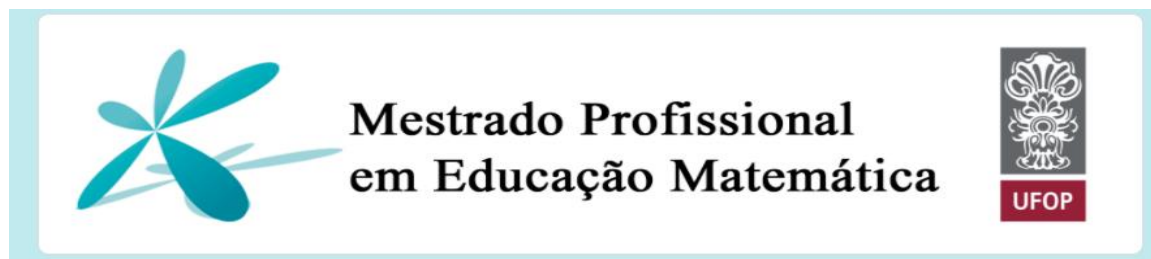
Figura 7 – Cabeçalho do jogo

Começamos o delineamento do jogo no Google Forms pelo seu cabeçalho.