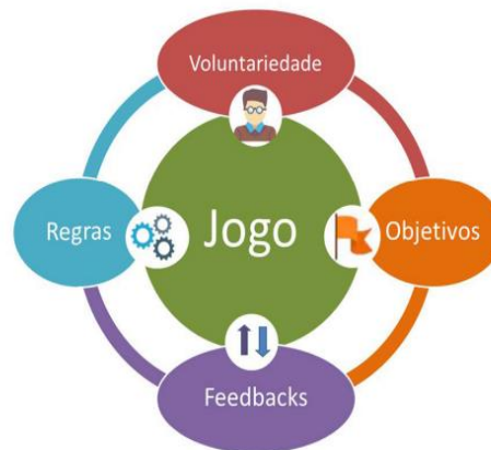
Figura 3: Representação dos elementos de um game

Para Silva, Sales e Castro (2019), no processo de gameificação, os elementos devem estar interconectados, fazendo com que o produto final possa produzir uma experiência próxima a de um game completo, como ilustrado na figura a seguir.