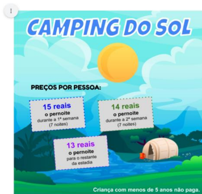
Figura 10 – Camping do Sol

Após conhecer a proposta do Camping do Sol e do Camping dos Pássaros , o(s) participante(s) poderá(ão) iniciar o jogo.