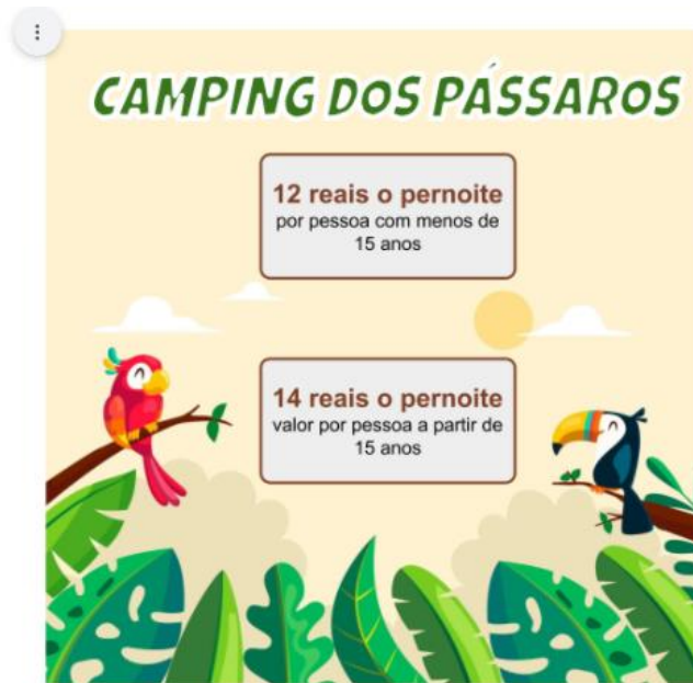
Figura 11 – Camping dos Pássaros