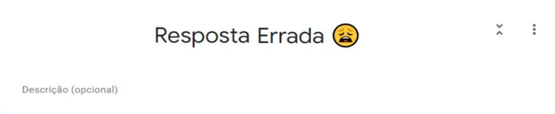
Figura 14 – Mensagem de erro da questão

Em todas as etapas do jogo se o(s) participante(s) errar(em) as perguntas aparecerão a seguinte mensagem: