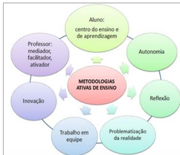
Figura 2 – Princípios que constituem as Metodologias Ativas de ensino