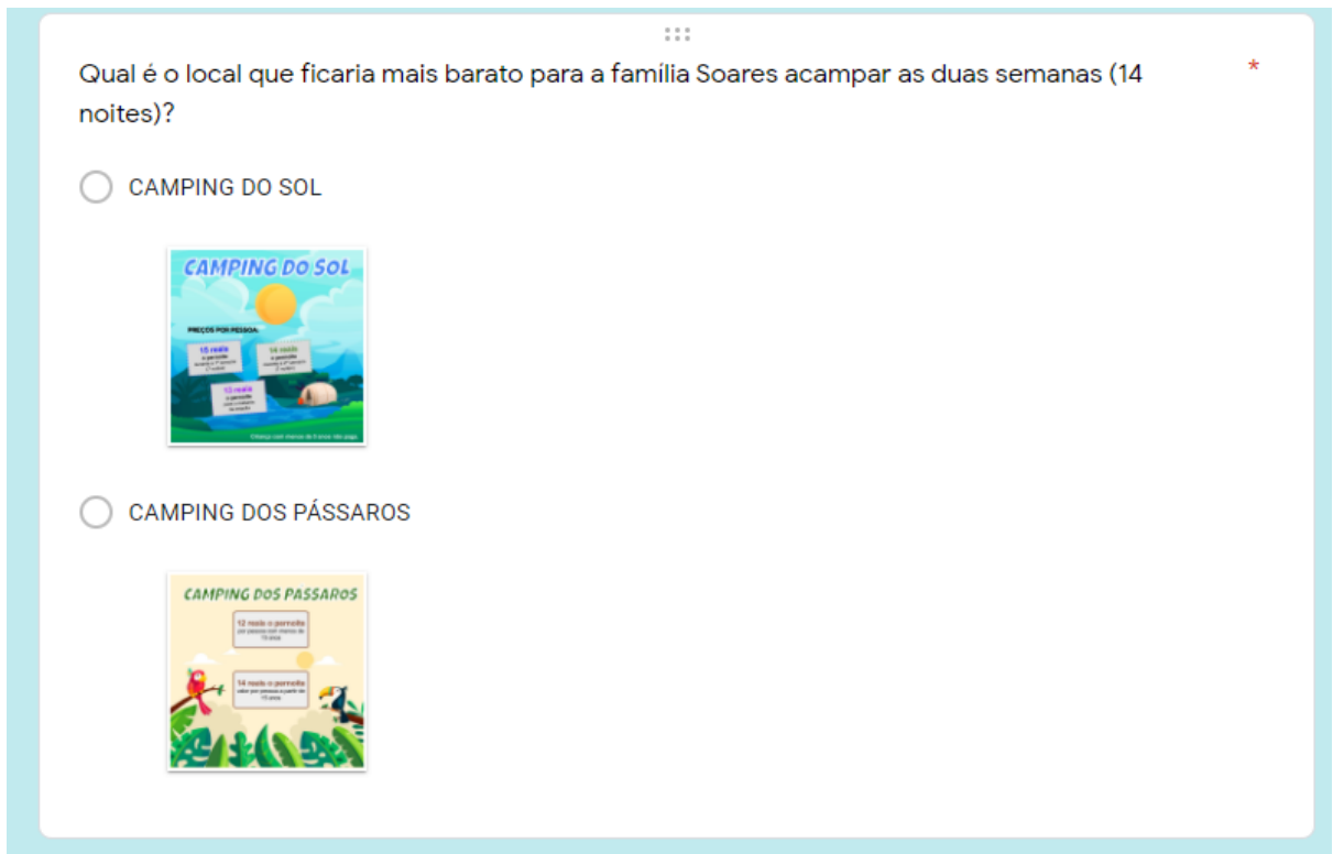
Figura 25 – 5ª Etapa do Jogo

Encerrado os cálculos do valor da estadia em cada Camping, o(s) jogador(es) escolherá(ão) o Camping que ficará mais barato para a Família Soares acampar.