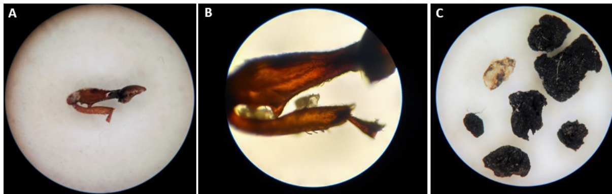
Figura 2 – Sujidades encontradas em amostras de salsa desidratada. Perna de inseto (A) com detalhes (B) e fragmentos de pedras (C)

Visualização em microscópio estereoscópio (A, C) e microscópio ótico (B, ampliação de 100x)